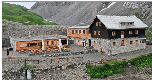
Die sanierte »Anhalter Hütte« mit dem denkmalgeschützten Altbau von 1912, dem neu erstellten Anbau sowie dem separaten Technikgebäude mit Winterraum

Nun hat das SV-Wirtshaus noch einen Biergarten und wird von einem Team aus dem Sportverein betrieben. Auch die Sportanlage soll bald um einen Trainingsplatz und ein Kleinspielfeld erweitert werden – als Basis für die sportliche Betätigung der Jugend.